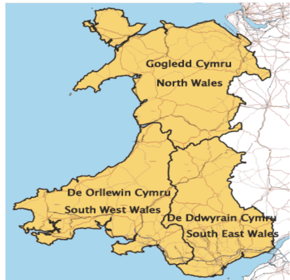
Map: Ardaloedd Cynllun Gwastraff Rhanbarthol Cymru

Mae'r RWPau yn cynnig datganiad o'r ffordd y byddant yn cyfrannu at amcanion rheoli gwastraff cyffredinol y Gyfarwydddeb Safleoedd Tirlenwi a'r Strategaeth Wastraff Genedlaethol .